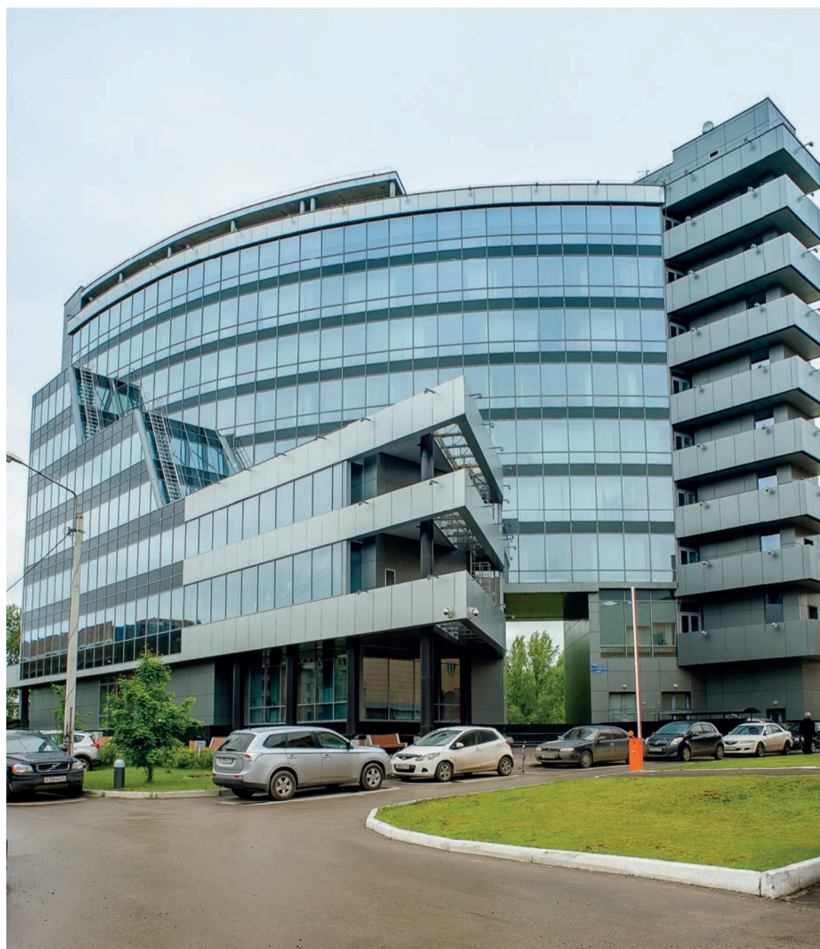
Административное здание Управления