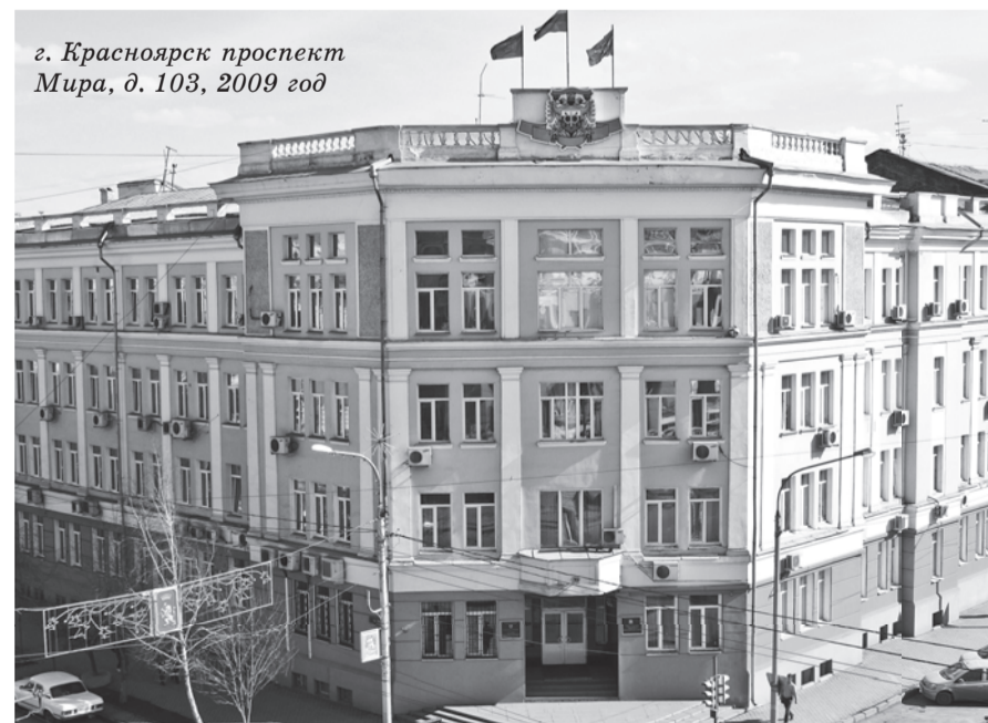
г. Красноярск проспект Мира, д. 103, 2009 год

Поэтому в 2007 году начато проектирование нового здания, а непосредственно строительство началось в сентябре 2008 года и закончилось в 2011 году переездом в новое административное здание (На Партизана Железняка 44д).