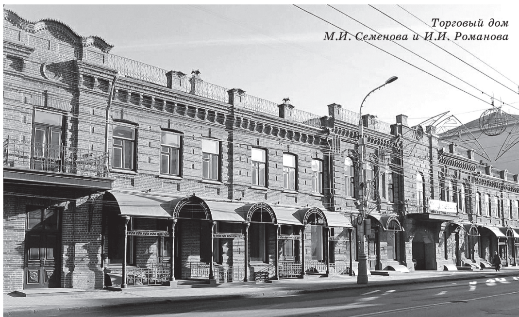
Торговый дом М.И. Семенова и И.И. Романова

Здание построено в 1899 – 1900 гг., архитектор Фольбаум А.А., является памятником архитектуры конца XIX века. Современный адрес здания: г. Красноярск, проспект Мира, д. 86.