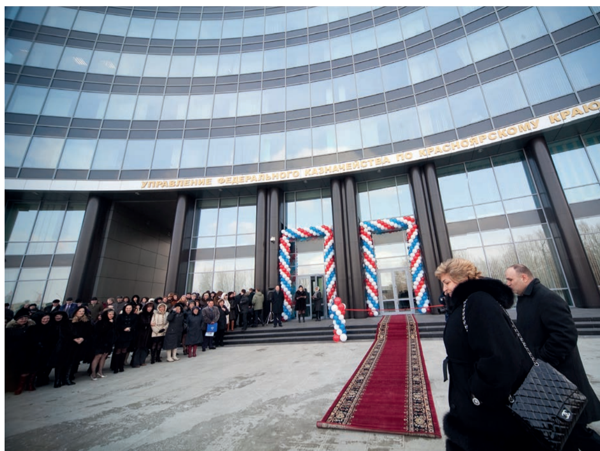
Торжественная церемония открытия нового административного здания Управления по адресу: г. Красноярск, улица Партизана Железняка, 44д

В 2014 году Управление начало осуществлять кассовое обслуживание исполнения бюджетов Территориального фонда обязательного медицинского страхования Красноярского края, Пенсионного фонда РФ и Фонда социального страхования РФ.