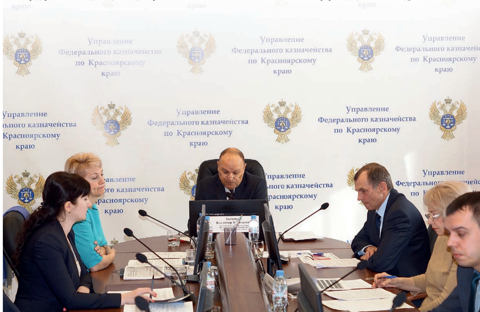
Расширенное заседание Коллегии УФК по Красноярскому краю в формате видеоконференции, 11 апреля 2017 года, г. Красноярск

Заслуженный экономист Российской Федерации. Награжден медалью ордена «За заслуги перед Отечеством» II степени, нагрудным знаком Министерства финансов Российской Федерации «Отличник финансовой работы», Почетными грамотами Федерального казначейства, Губернатора Красноярского края, Законодательного Собрания Красноярского края, Главы города Красноярска, занесен на Доску почета Федерального казначейства, имеет ряд других наград и поощрений.