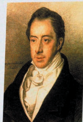
◀ Николай Иванович Тургенев. Художник Е.И. Эстрейк, 1823 г. Государственный исторический музей, Москва

С. Ю. Витте, русский государственный и политический деятель (1849–1915)