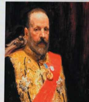
▶ Портрет С.Ю. Витте. Художник Илья Репин (1901–1903), Третьяковская галерея

как таковым) иногда затрудняются ответить на вопросы, связанные с глубоким пониманием статей кодекса.