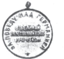
Оборотная сторона медали.