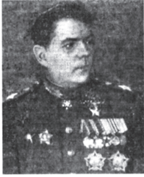
Маршал Советского Союза А. М. Василевский.