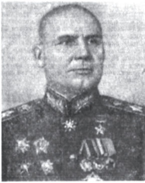
Маршал Советского Союза И. С. Конев.