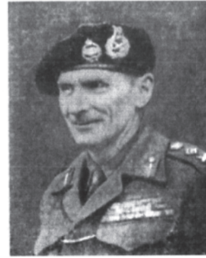
Фельдмаршал Б. Монтгомери.