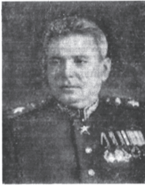
Маршал бронетанковых войск Я. Н. Федоренко.