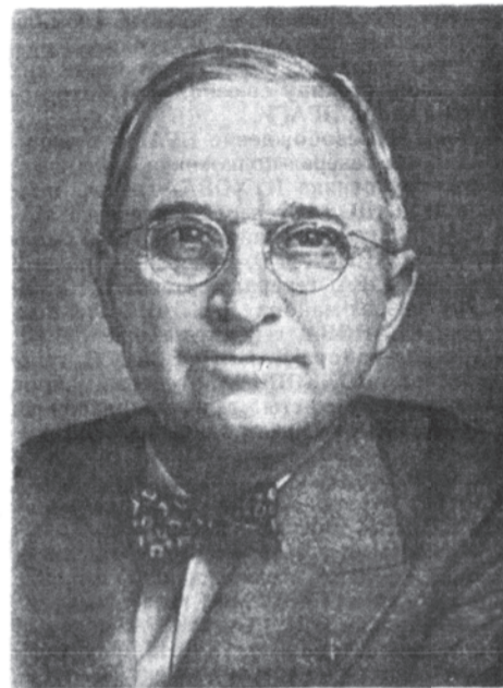
Президент США Г. Труман.