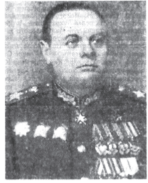
Маршал Советского Союза К. А. Мерецков.