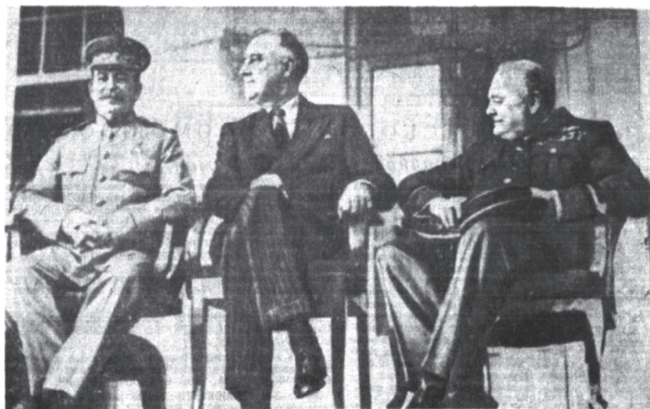
И. В. Сталин, Ф. Д. Рузвельт и У. Черчилль в дни Тегеранской конференции.

ВЕЧНАЯ СЛАВА ГЕРОЯМ, ПАВШИМ В БОЯХ С ВРАГОМ И ОТДАВШИМ СВОЮ ЖИЗНЬ ЗА СВОБОДУ И СЧАСТЬЕ НАШЕГО НАРОДА!