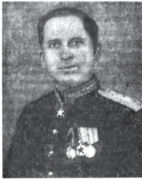
Маршал войск связи И. Т. Персыпкин.