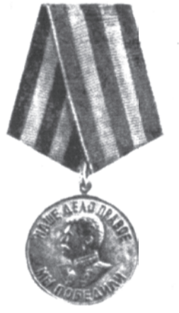
Лицевая сторона медали.

Медаль круглая, изготавливается из латуни. На лицевой стороне медали профилированное изображение товарища И. В. Сталина в форме Маршала Советского Союза. В верхней части медали по окружности надпись: «Наше дело правое», в нижней части по окружности надпись: «Мы победили!» На оборотной стороне медали надпись: по окружности — «За победу над Германией в Великой Отечественной войне 1941—1945 гг.», в центре — «В Великой Отечественной войне 1941—1945 гг.»