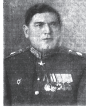
Маршал инженерных войск М. П. Воробьев.