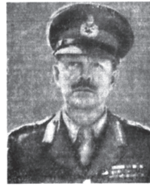
Фельдмаршал Г. Александер.