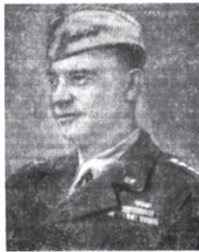
Генерал Д. Эйзенхауэр.