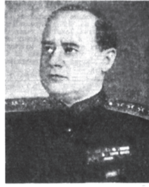
Адмирал флота И. С. Исаков.