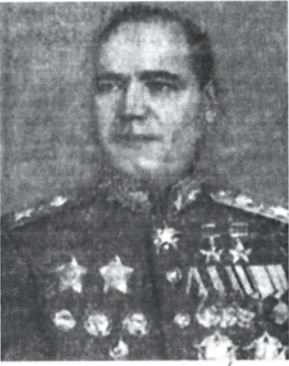
Маршал Советского Союза Г. К. Жуков.