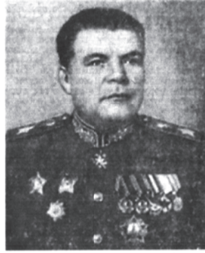
Маршал Советского Союза Р. Я. Малиновский.