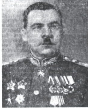
Маршал Советского Союза Л. А. Говоров.