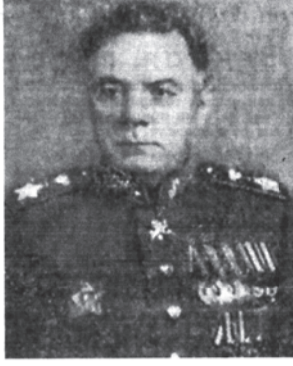
Маршал Советского Союза К. Е. Ворошилов.