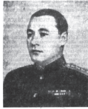
Адмирал флота Н. Г. Кузнецов.