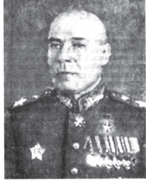
Маршал Советского Союза С. К. Тимошенко.