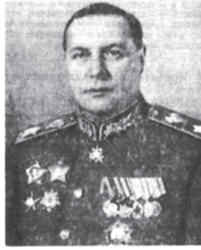
Маршал Советского Союза Ф. И. Толбухин.