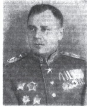
Главный Маршал авиации А. А. Новиков.