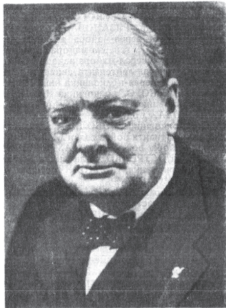
Премьер-министр Великобритании У. Черчилль.