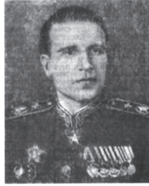
Главный Маршал авиации А. Е. Голованов.