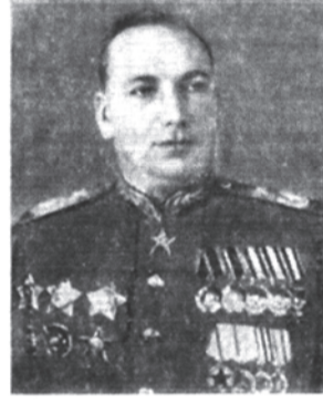
Главный Маршал артиллерии Н. Н. Воронов.