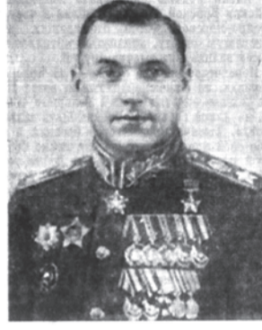
Маршал Советского Союза К. К. Рокоссовский.