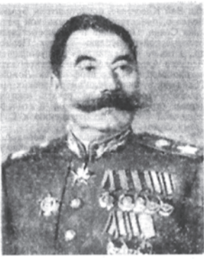
Маршал Советского Союза С. М. Буденный.