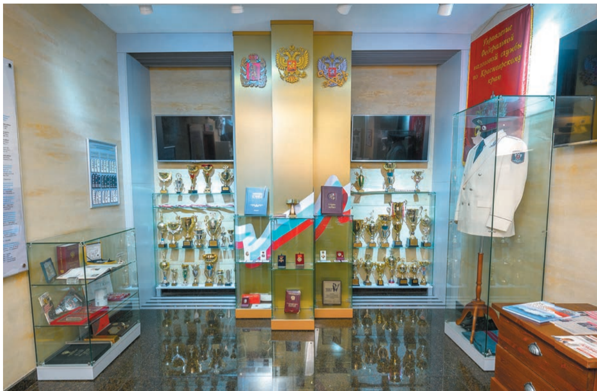
Золотой зал музея