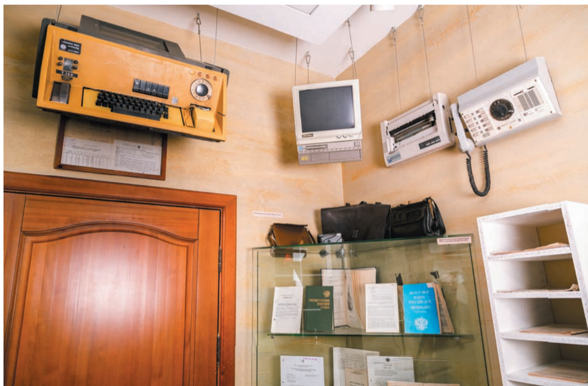
Оргтехника, инструкции, методические рекомендации 1990-ых годов