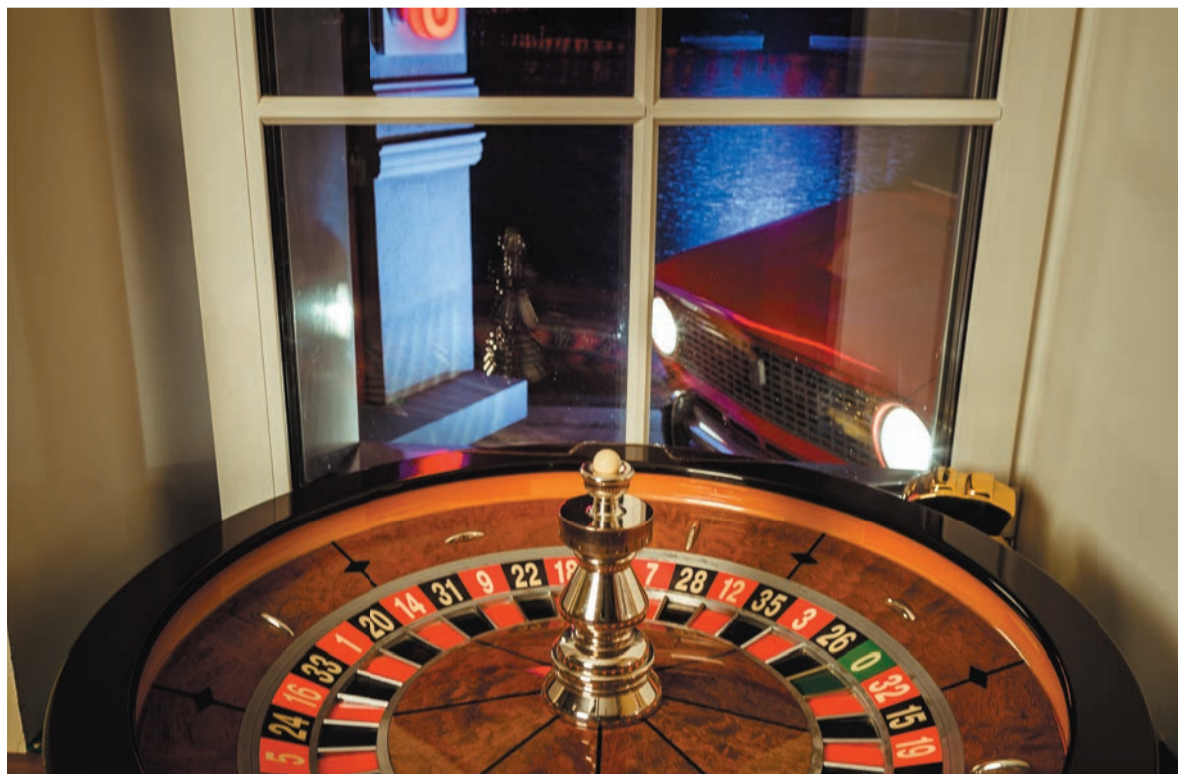
Исталляция «Налогообложение игорного бизнеса в 2000-2007 годах»