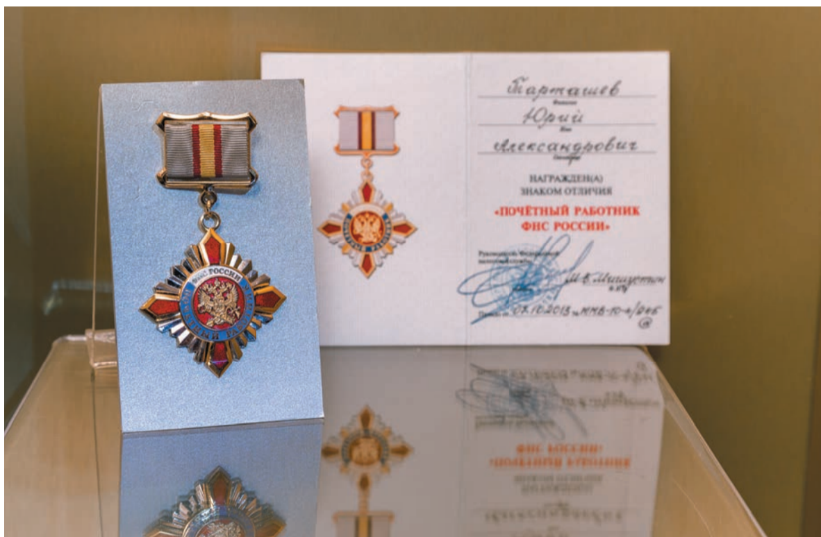
Ведомственная награда «Почетный работник ФНС России»