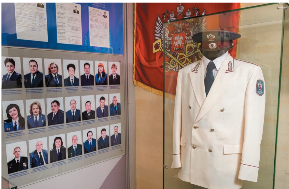
Парадная форма налогового инспектора