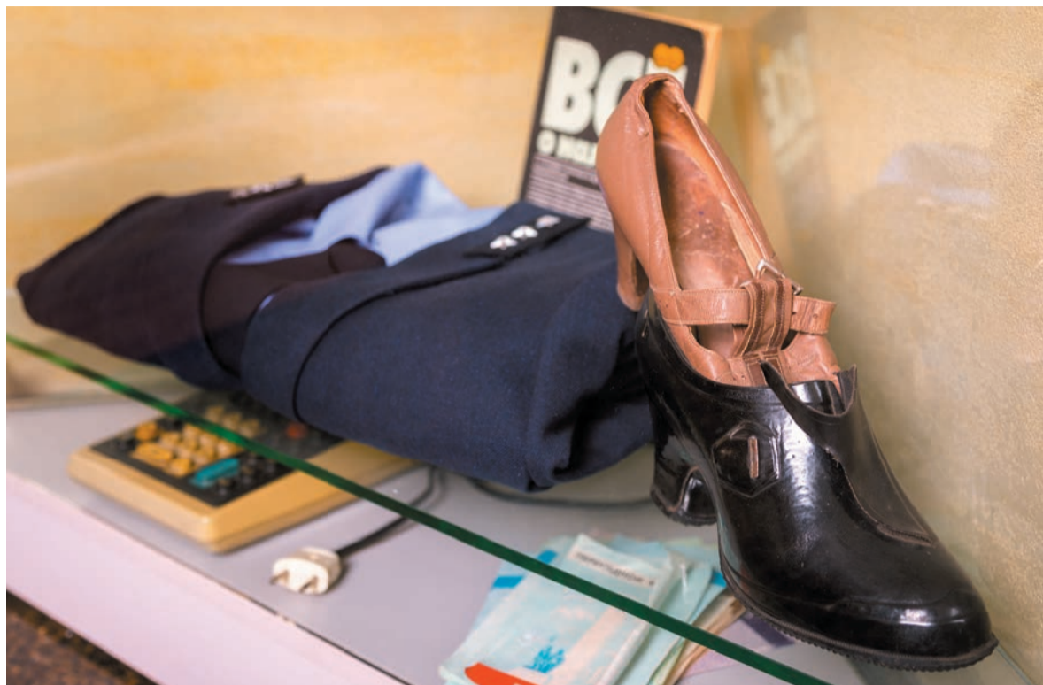
Форма налогового инспектора, калоши для туфель на каблуке, 1991 г.

Все эти экспонаты представляют «живую» историю налоговых органов Красноярского края, находящую теплый отклик в сердцах людей. Ведь еще живы современники этой истории, а некоторые еще остаются на государственной службе и продолжают создавать новейшую историю Налоговой службы Красноярского края.