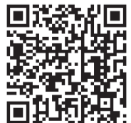
QR-код этого номера

ПЕРЕПЕЧАТКА МАТЕРИАЛОВ, ОПУБЛИКОВАННЫХ В ГАЗЕТЕ «НАЛОГОВЫЕ ВЕСТИ КРАСНОЯРСКОГО КРАЯ», ДОПУСКАЕТСЯ ТОЛЬКО С ПИСЬМЕННОГО СОГЛАСИЯ РЕДАКЦИИ. Материалы, отмеченные знаком ©, публикуются на правах рекламы. Редакция не несет ответственности за содержание рекламных материалов. Газета «Налоговые вестии Красноярского края» – является периодическим печатным изданием, специализирующимся на распространении информации производственно-практического характера.