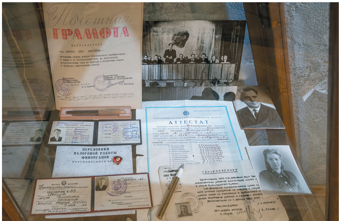
Передовики финорганов Красноярского края