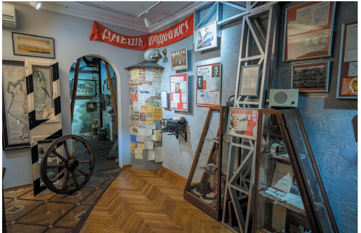
Символы Эпохи пятилеток СССР: стройотряды, БАМ. II половина XX в.

Мы продолжим нашу экскурсию по залам музея налоговых органов Красноярского края в следующих выпусках газеты.