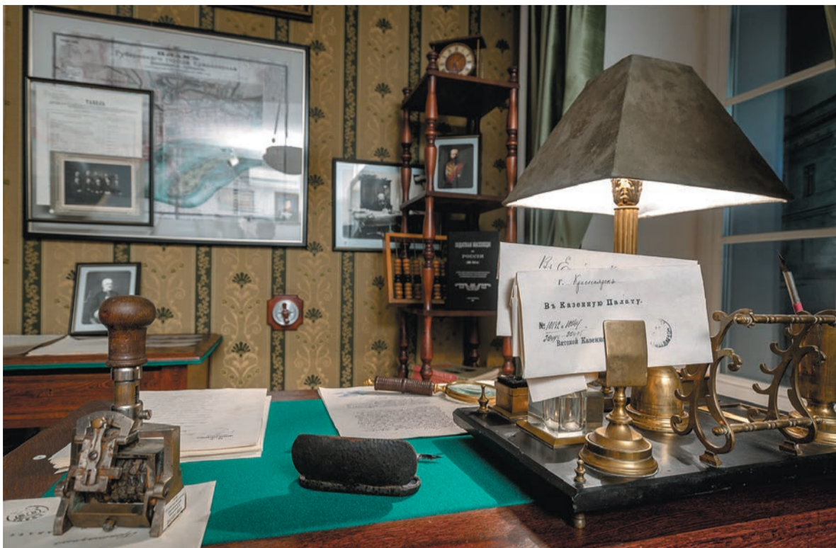
Интерьер кабинета податного инспектора Енисейской губернии. 1893г.