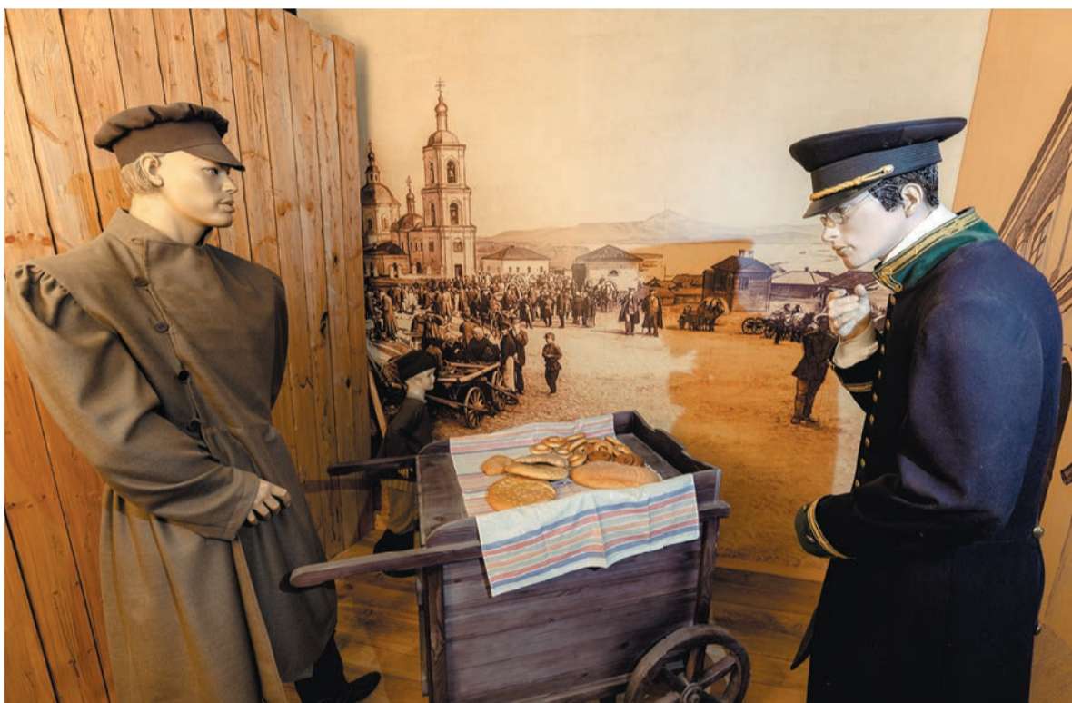
Диорама Старобазарной площади, г. Красноярск. Конец XIX века