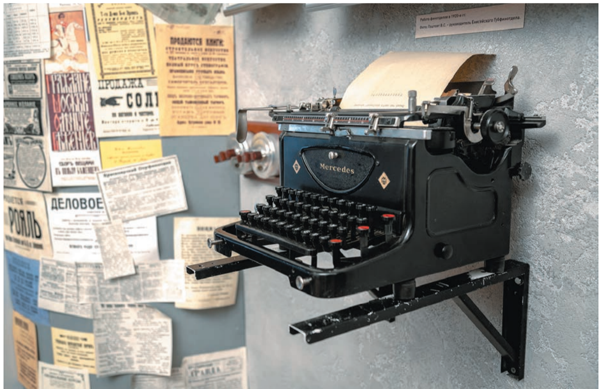
Машинка пишущая механическая «Mercedes». Германия, 1933 г.