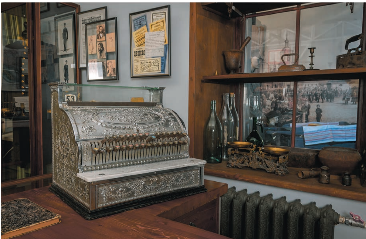
Серебряный Кассовый аппарат «National cash register». Начало XX века