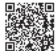
QR-код этого номера

ПЕРЕПЕЧАТКА МАТЕРИАЛОВ, ОПУБЛИКОВАННЫХ В ГАЗЕТЕ «НАЛОГОВЫЕ ВЕСТИ КРАСНОЯРСКОГО КРАЯ», ДОПУСКАЕТСЯ ТОЛЬКО С ПИСЬМЕННОГО СОГЛАСИЯ РЕДАКЦИИ. Материалы, отмеченные знаком ©, публикуются на правах рекламы. Редакция не несет ответственности за содержание рекламных материалов. Газета «Налоговые вестии Красноярского края» – является периодическим печатным изданием, специализирующемся на распространении информации производственно-практического характера.