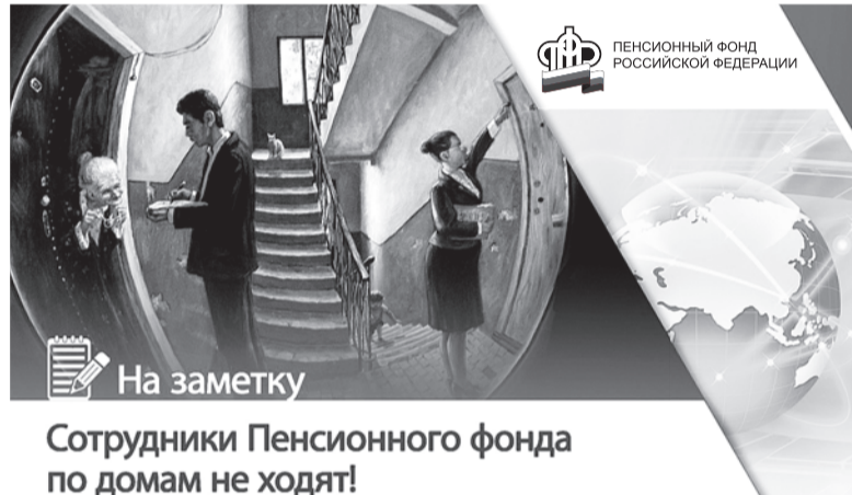
Сотрудники Пенсионного фонда по домам не ходят!

Берегите себя и свои персональные данные!