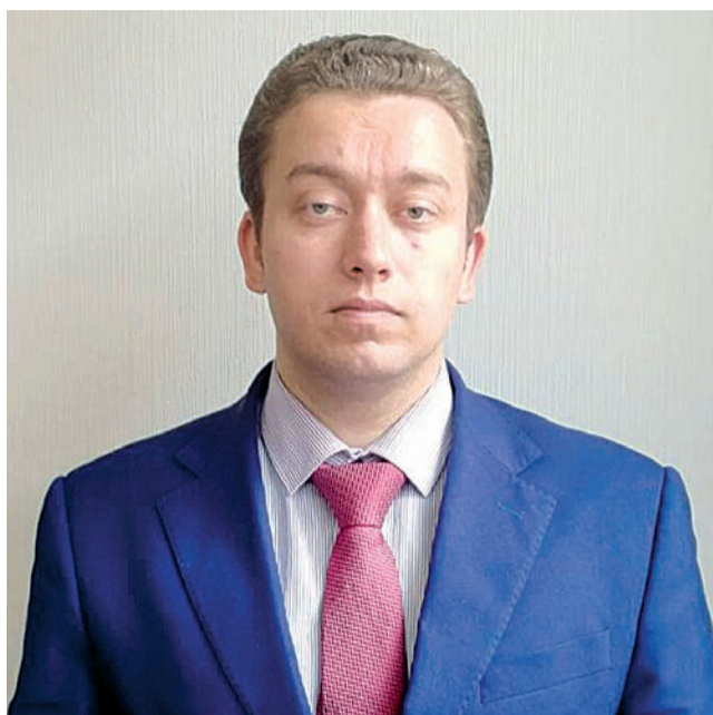
Сергей Александрович, расскажите, пожалуйста, о новациях 2021 года в сфере НДС.

Интересные для налогоплательщиков поправки внесены в главу 21 НК РФ Федеральным законом от 23.11.2020 № 374-ФЗ. В частности, до конца 2021 года продлено применение налоговой ставки 10 % для услуг по внутренним воздушным перевозкам пассажиров и багажа, предусмотренной подп. 6 п. 2 ст. 164 НК РФ. Действие льготы, изначально временной, несколько раз продлевалось. Она не касается воздушных перевозок в Крым, Севастополь, Калининград, на Дальний Восток и обратно, а также любых внутрироссийских рейсов, в которых пункт отправления, пункт назначения и все промежуточные пункты не находятся в Москве или Московской области: по таким перевозкам применяется налоговая ставка 0%.