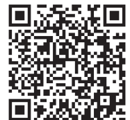
QR-код этого номера

ПЕРЕПЕЧАТКА МАТЕРИАЛОВ, ОПУБЛИКОВАННЫХ В ГАЗЕТЕ «НАЛОГОВЫЕ ВЕСТИ КРАСНОЯРСКОГО КРАЯ», ДОПУСКАЕТСЯ ТОЛЬКО С ПИСЬМЕННОГО СОГЛАСИЯ РЕДАКЦИИ. Материалы, отмеченные знаком ©, публикуются на правах рекламы. Редакция не несет ответственности за содержание рекламных материалов. Газета «Налоговые вести Красноярского края» – является периодическим печатным изданием, специализирующемся на распространении информации производственно-практического характера.