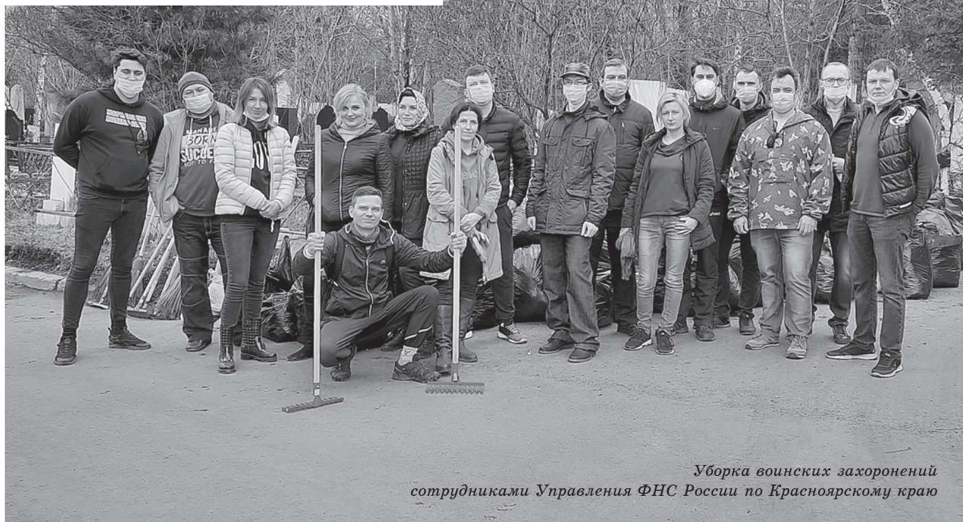
Уборка воинских захоронений сотрудниками Управления ФНС России по Красноярскому краю